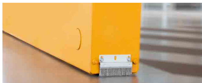
Kjørehjul på gulv uten styreskinner